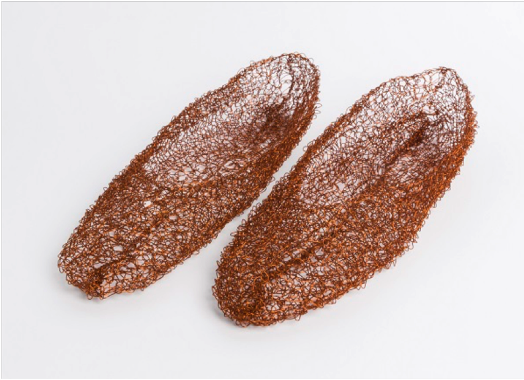
Sans titre ( petites chaussures ). 1975.